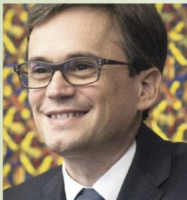
Christian Vitta, Consigliere di Stato del Cantone Ticino e Direttore del Dipartimento delle finanze e dell'economia

Qu'il s'agisse d'énergie, de service public, d'agriculture ou de tourisme, le SAB veille à la cohésion nationale.