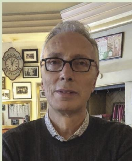
Jean-François Roth, président de Suisse Tourisme

Grâce à l'engagement du SAB et des cantons, le programme FORTA permet l'intégration des régions périphériques dans le réseau routier national, tout en garantissant le financement des routes cantonales de montagne.