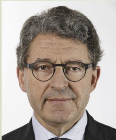
Heinz Brand, Nationalrat des Kantons Graubünden

Die Berggebiete allgemein und ganz besonders der Alpenbogen brauchen neue wirtschaftliche Entwicklungsperspektiven. Es ist daher wichtig, dass es eine Organisation wie die SAB gibt, die sich für diese Räume engagiert und ihre Interessen verteidigt.