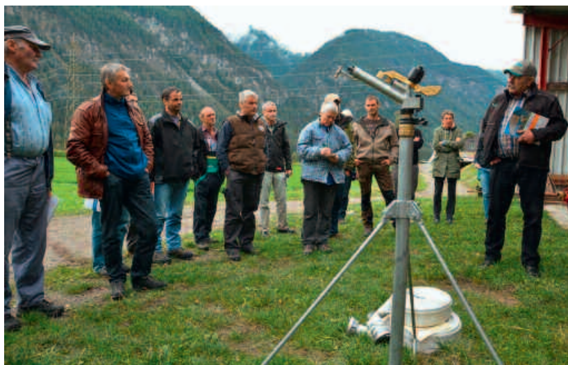
Bewässerungskurs im Parc Ela, September 2015.

Die Phase der Projektumsetzung, die bisher sehr positiv verläuft und