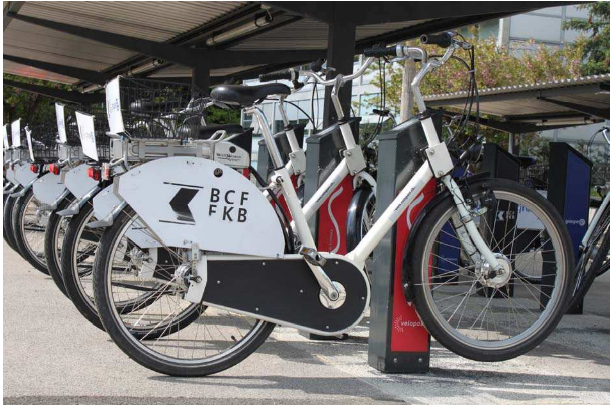
NRP Projekt Fri2bike