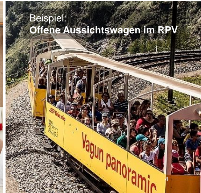
Beispiel: Offene Aussichtswagen im RPV