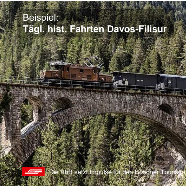
Beispiel: Tägl. hist. Fahrten Davos-Filisur