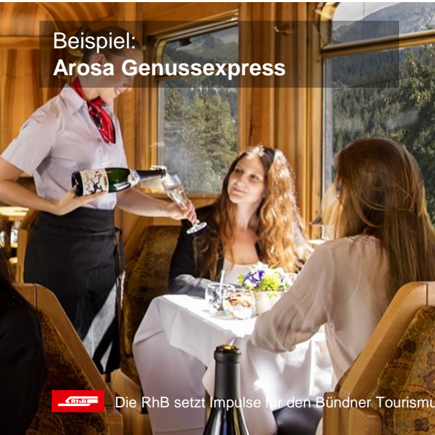
Beispiel: Arosa Genussexpress