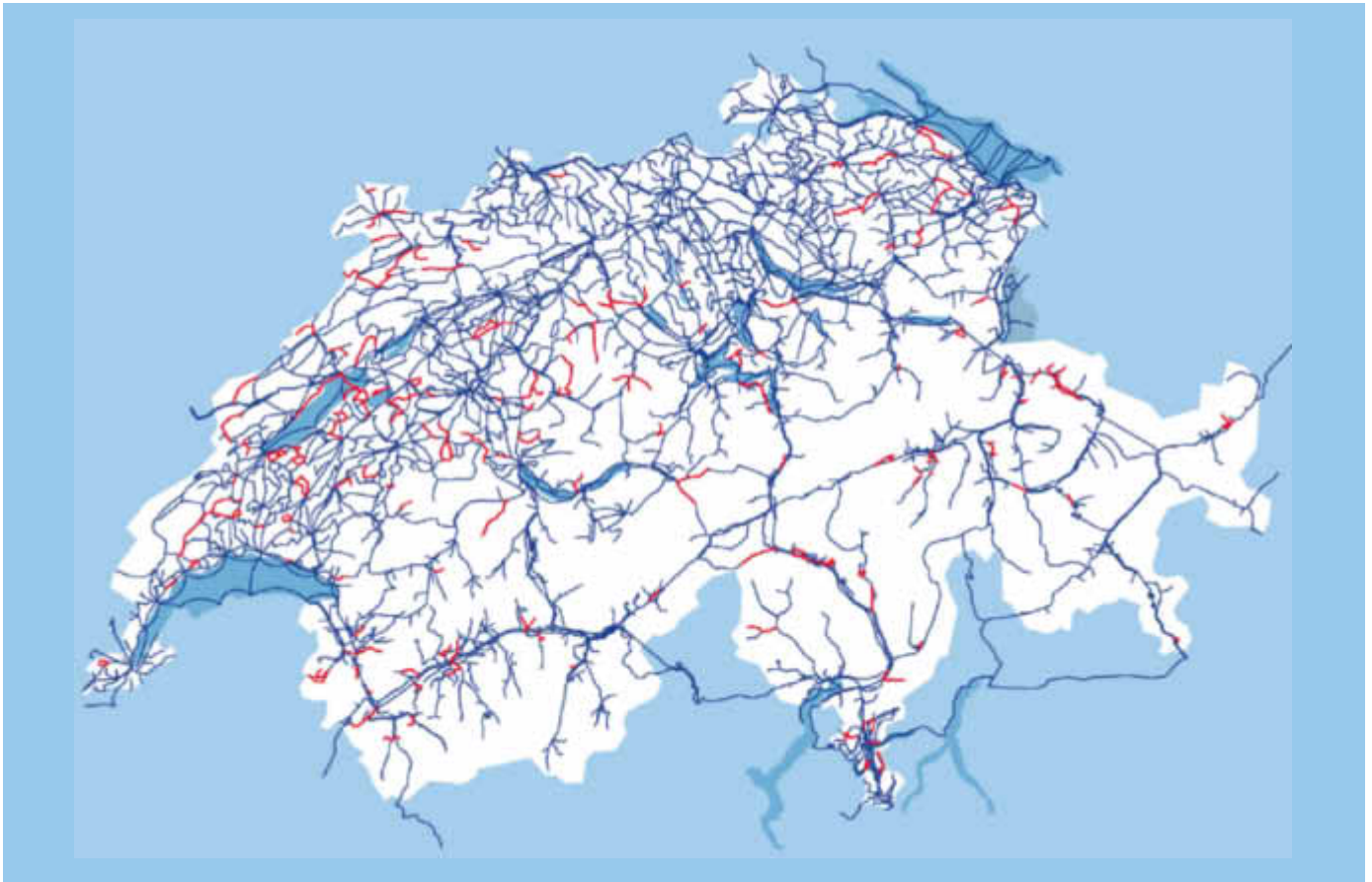
Das öV-Netz Schweiz – die gefährdeten Linien sind rot markiert.