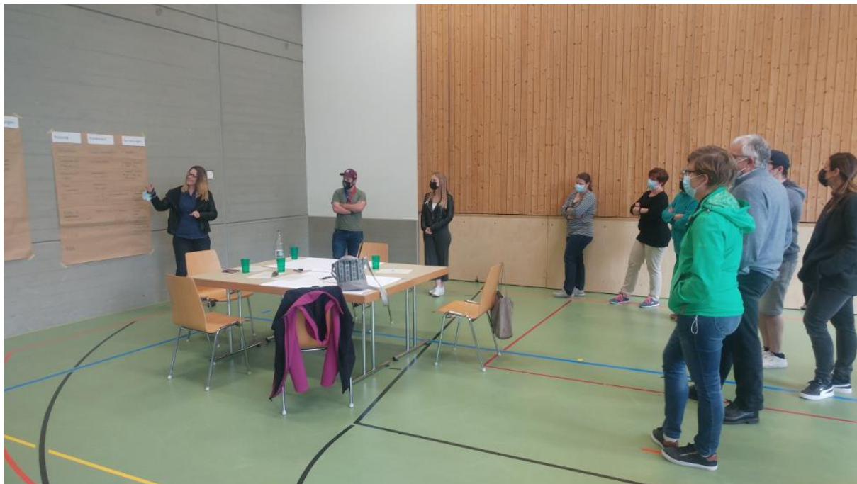
Processus de planification participatif Espace jeunesse et aire de jeux pour enfants Commune de Sattel (PN)