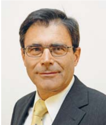
Responsable de la communication d'entreprise, La Poste Suisse