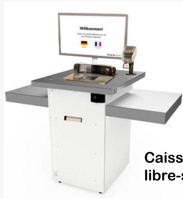
Caisse en libre-service