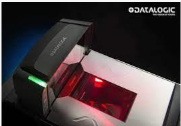
Scanner haut de gamme