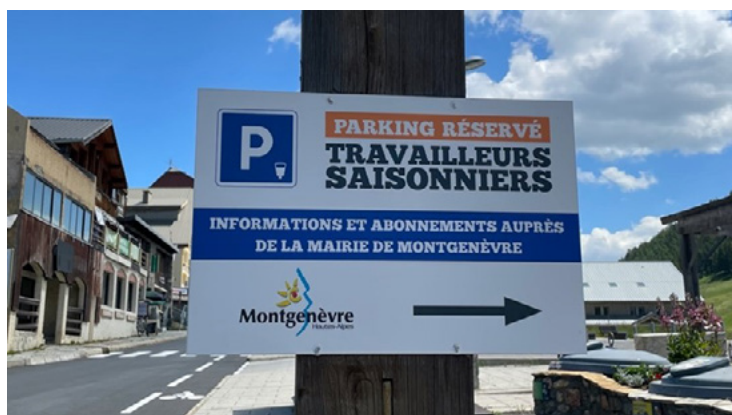
Parking für Saisonangestellte in Montgenèvre.

Wenn eine Gemeinde eine Wohnraumanalyse vornimmt und eine Wohnraumstrategie erarbeitet, sollte sie also unbedingt auch den Mobilitätsfragen eine besondere Beachtung schenken und dabei auf die spezifischen Bedürfnisse der Angestellten im Tourismus achten.