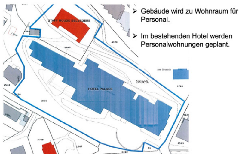
Abparzellierung eines Gebäudes für Personalwohnungen.

Die Gemeinde Lauterbrunnen belässt es nicht bei Aufrufen und Sensibilisierungsarbeit, sondern schafft auch konkrete Angebote. Eine Gelegenheit dazu bot sich in Zusammenhang mit dem leerstehenden Hotel Palace und dem dazugehörigen ungenutzten «Staff House». Die Gemeinde hat das «Staff House» abparzelliert und somit die Möglichkeit für verschiedenen Beherbergungsbetriebe eröffnet, ihr Personal dort unterzubringen. Aktuell (Stand Januar 2025) ist zudem in Mürren ein neues Personalhaus mit 13 Wohneinheiten geplant, welches durch die Schilthornbahn AG erstellt werden soll.