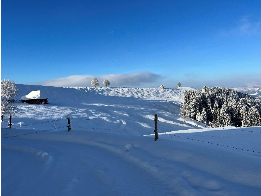
Unterwegs im Emmental am 27.11.2025